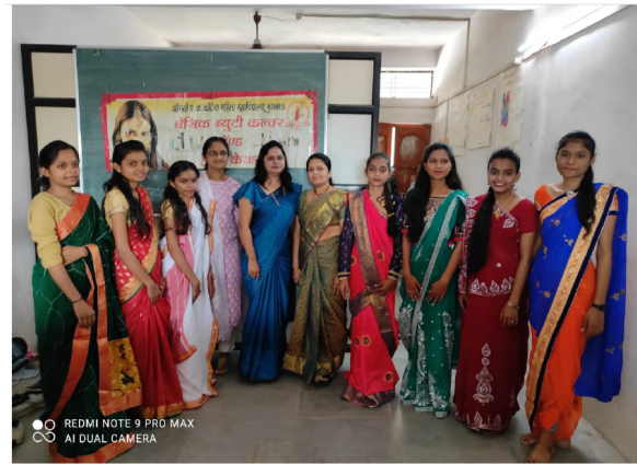
Workshop on Saree drapping